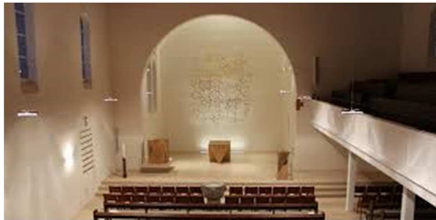
Innenansicht Evang.-luth. Himmelfahrtskirche, Freising